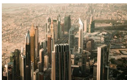
PAYS DU GOLFE

2019 - Retrouvez tous nos évènements sur www.cpmeauvergnerhonealpes.fr